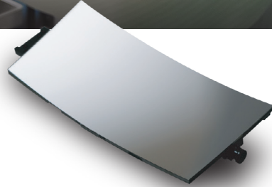
HUDのキーパーツ【凹面鏡】 一貫加工の内製化により 高精度・高品質の表示画像を実現

Nippon Seiki Group's strengths lie in its manufacturing technologies such as high-density mounting technology, precision molding, resin molding, printing. And also the integrated development-to-production system that combines software, circuit, mechanical design and verification technologies. We are also enhancing our competitiveness by introducing in-house production of key components, such as movements that indicates car speed, engine speed, and printed circuit boards which are indispensable for digital display.