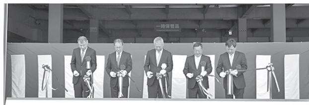
祝 日精サービス株式会社 長岡ロジスティクスセンター 竣工式