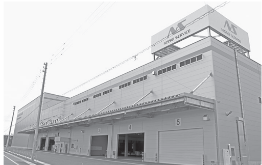
完成した新倉庫の外観