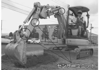
センサーユニット

ばかりの女性社員だったこと。ユニットの磁石も強力で、掘削中にアームが揺れてもずれないことが無かった。 大型の建機はガイダンスコントロールが普及し始めている。一方で、ミニショベルの補助システムはあまり例がなかった。アイムとセンサーユニットの組み合わせが、ミニショベルの補助システムに目を付けた。アイムとセンサーユニットの組み合わせが、ミニショベルの補助システムに目を付けた。